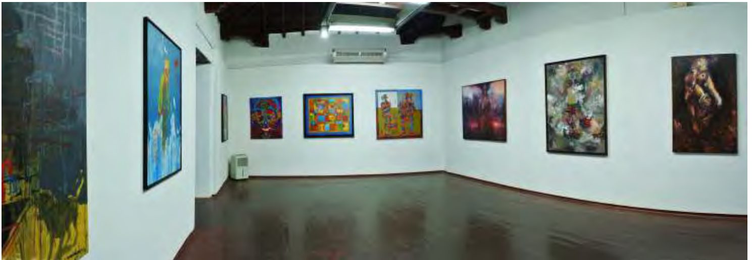
Sala de exhibición del museo