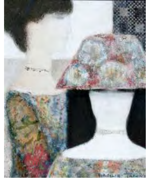
Virgilio Trompiz, Sin Título