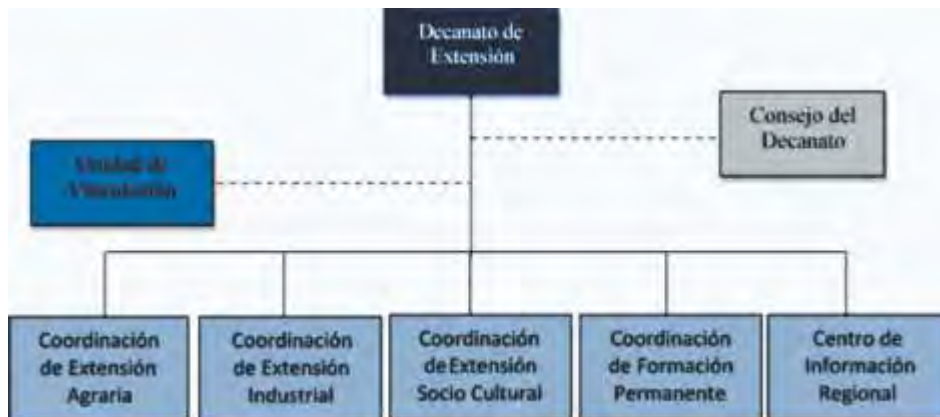
Figura 4. Unidad staff propuesta dentro de la estructura organizacional del Decanato de Extensión