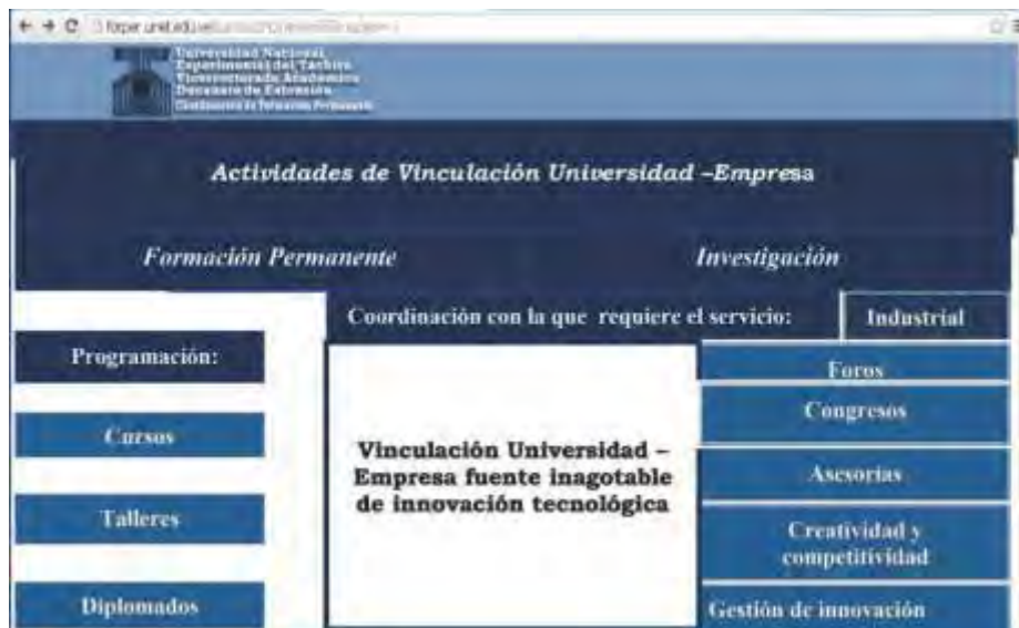
Figura 2. Blog de actividades de vinculación universidad-PyME, sector textil.