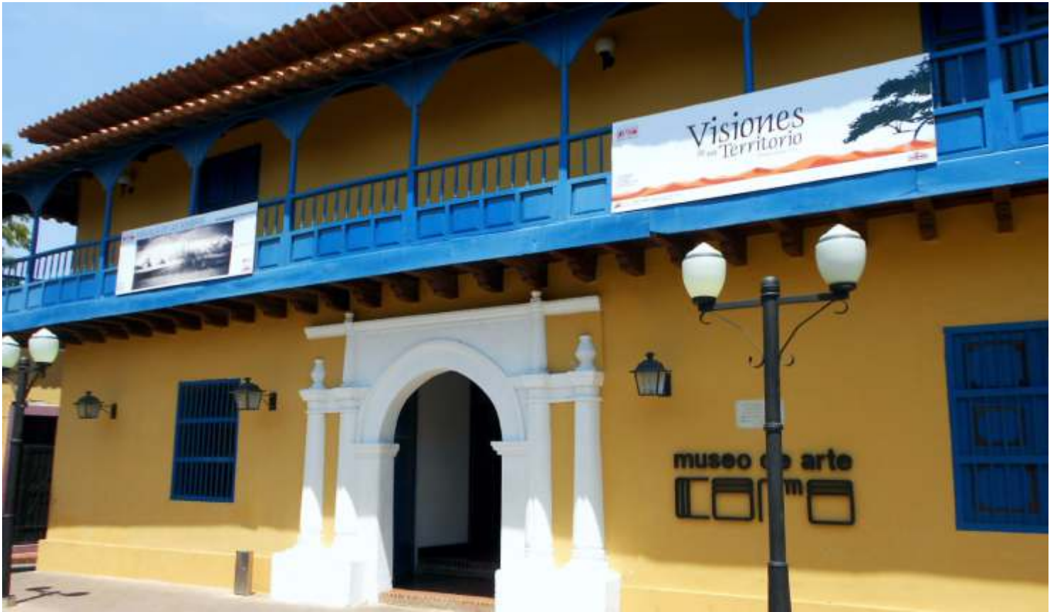
Fachada del museo, en close up