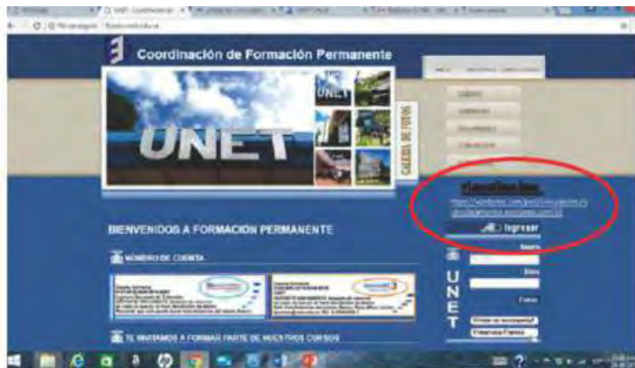
Figura 1. Enlace para el blog de vinculación universidad-PyME, sector textil.

con la Coordinación de Formación Permanente, por ser el ente formal en la universidad dedicado a dictar cursos, talleres, programas, seminarios, dirigidos a la comunidad tachireNSE. A su vez, estará apoyada por el Decanato de Investigación, para la gestión de innovación e investigación, direccionada a cubrir las necesidades de las PyME, sector textil (ver figuras 1 y 2).